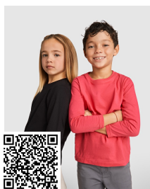
POINTER CHILD CA1205