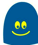
manches 10 x 10 cm