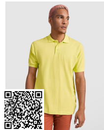
PEGASO PREMIUM PO6609