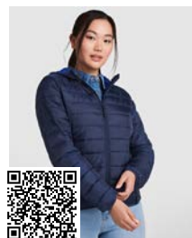
NORWAY WOMAN RA5091