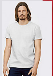
SOL'S IMPERIAL 11500