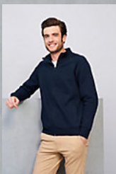
SOL'S SUNDAE 47200