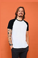
SOL'S FUNKY 11190